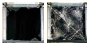
ガラスのみ フィルム貼付