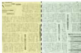
ガラスのみ フィルム貼付